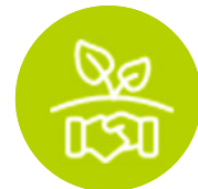
Green Meetings & Green Events